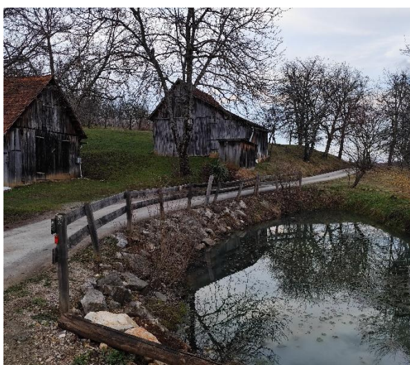
Naravna vrednota Miliči – kal; foto: Vesna Fabjan, marec 2025