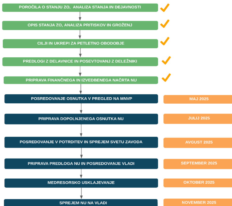
Slika 2. Proces priprave načrta upravljanja Krajinskega parka Kolpa 2026–2030 s prikazom že opravljenih korakov ter časovnico dokončanje priprave načrta in sprejema na Vladi.

V letih 2023 in 2024 je bilo pripravljenih več korakov v procesu priprave načrta upravljanja. Dokument je bil v maju in z dopolnitvami v juliju 2025 poslan v pregled MNVP, pričakujemo sprejem načrta upravljanja do konca letošnjega leta. Časovnica procesa priprave NU je prikazana na sliki 2. Sprejem NU je za javni zavod ključnega pomena, saj bo omogočil bolj usmerjeno delovanje, stabilno financiranje in kadrovske krepitev, ki je za obvladovanje zavarovanega območja velikega pomena.