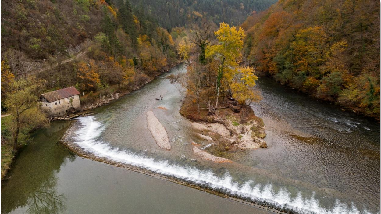
NV Kolpa, Žuniči – Breg pri Kolpi, delavnica KP Kolpa skozi objektiv, november 2024